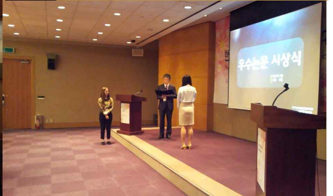
▲ 한국건강심리학회 제 52차 춘계학술대회 사진