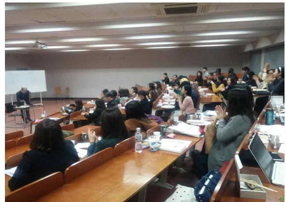
▲ 마음챙김-긍정심리연구회 16년 03월 월례회 사진