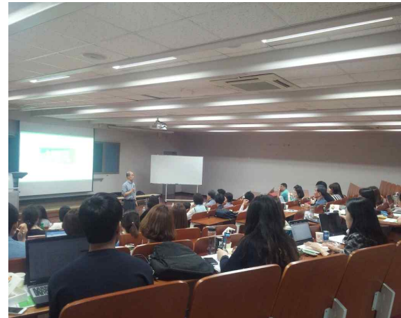
▲ 마음챙김-긍정심리연구회 16년 06월 월례회 사진