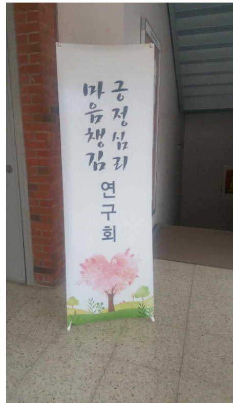
▲ 마음챙김-긍정심리연구회 17년 3월 월례회 사진