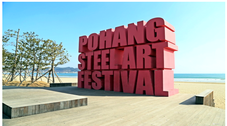
〈영일대해수욕장 스틸아트페스티벌 설치물〉