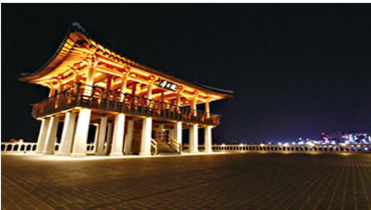
〈영일대 해상 누각 야경〉