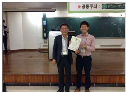
▲ 2019 건강심리학회 제 58차 춘계학술대회 사진